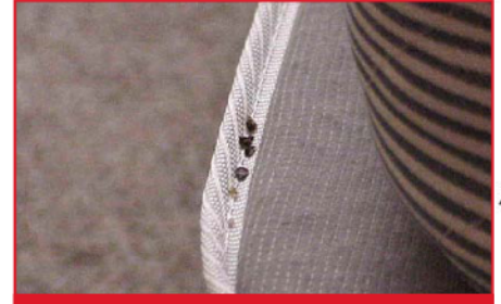
एक दुर्लभ दृश्य: जीवित बेड बग्स, सेब के बीजों के समान आकार वाले, जो दिन के दौरान अक्सर छुपे हुए होते हैं.