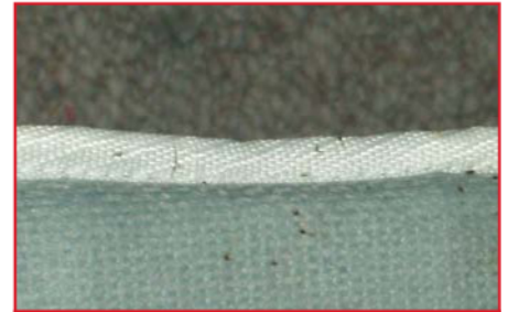
खुलासा करने वाले चिह्न: मैट्रेस या मैट्रेस टैग्स पर छोटे, नारंगी रंग के चिह्न.